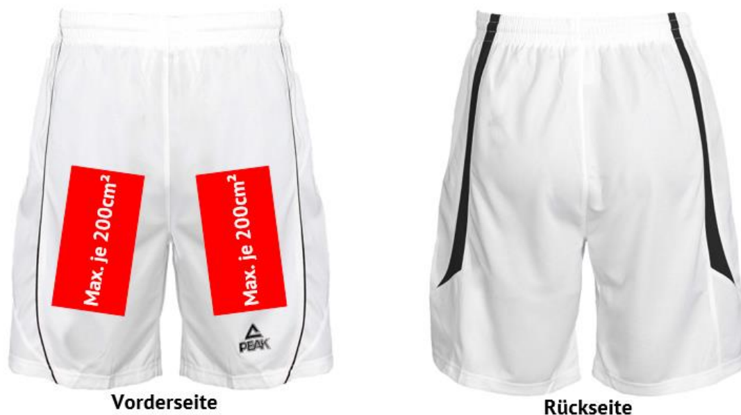
Abbildung 2: Werbeflächen Spielhose

Ein Mannschafts-/Vereinslogo ist zulässig und darf maximal 60 cm 2 groß sein. Das Mannschafts-/Vereinslogo gilt nicht als Werbefläche und kann zusätzlich zur Werbung angebracht werden.