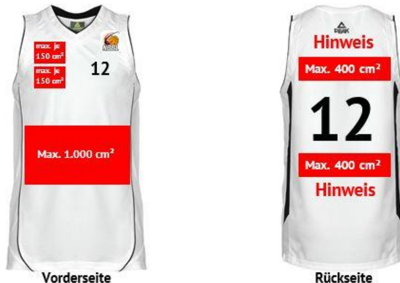
Abbildung 1: Werbeflächen Spielhemd (Beispiel)

Zusätzlich sind auf der Vorderseite des Spielhemds zwei weitere Flächen zulässig. Diese Flächen dürfen jeweils 150 cm 2 nicht überschreiten. Eine dieser Werbeflächen kann vom Bundesligisten vermarktet oder für das Aufbringen des Mannschafts-/Vereinslogos genutzt werden. Die zweite Werbefläche ist von dem Bundesligisten für Partner der NBBL gGmbH freizuhalten (siehe § 12 Abs. 4).